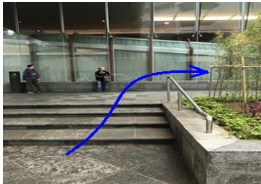
⑦ 橫過華蘭路後右轉到港島東中心入口。