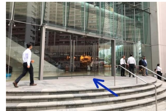
⑧ 到達港島東中心入口處。