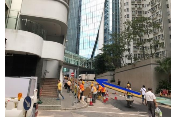
⑥ 沿濱海街斜路直上華蘭路。