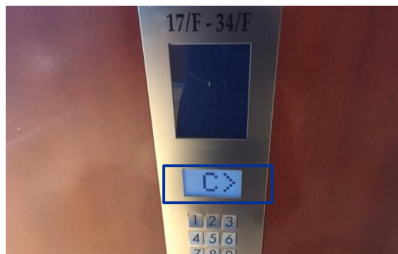
② (續) 在鍵盤上輸入 26/F。根據螢幕顯示前往指定電梯 (圖為電梯 C)。當您離開時，可直接按「Lobby」，螢幕會指示您應乘坐的電梯。