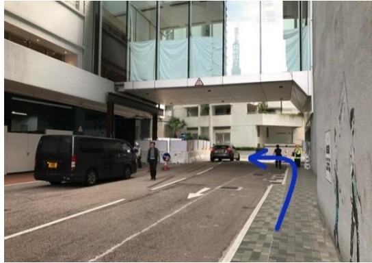
⑤ 沿路一直走到濱海街左轉。