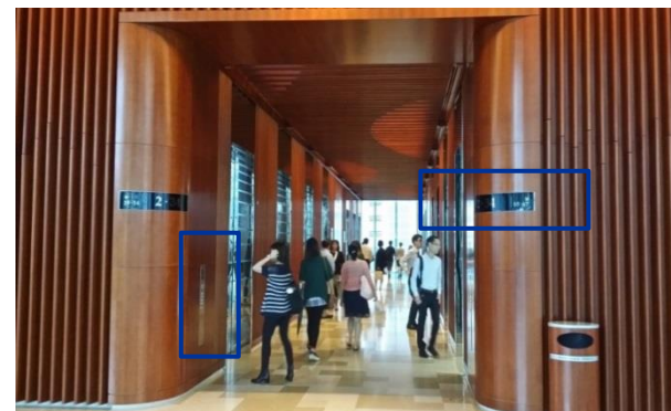
② 電梯兩旁有標示前往 17/F – 34/F 的鍵盤。