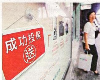
■儲蓄保險計劃包含保證及非保證回報，投保人要格外留意。

投保年齡由出生後15天至70歲均接受，保障年期至受保人100歲。投保人亦可因應個人需要，附加額外保障，包括意外、危疾、住院或免繳保費保障等，提供全面的保障服務。